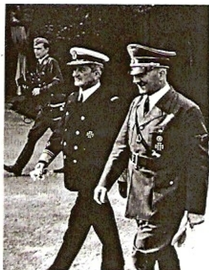
Links: Angehörige der Pfeilkreuzler-Bewegung in Budapest 1944; rechts: Hitler und der ungarische Reichsverweser Nikolaus von Horthy